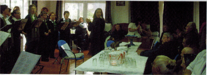
Inauguração da Academia Sénior de Vendas Novas