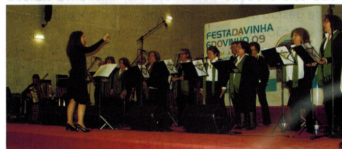
Aniversário da Tuna