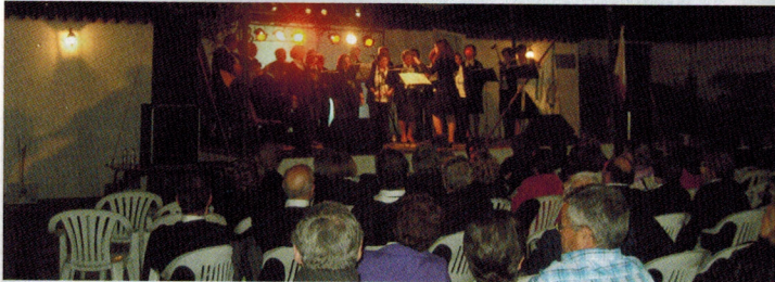
Concurso de Tunas em Abrantes