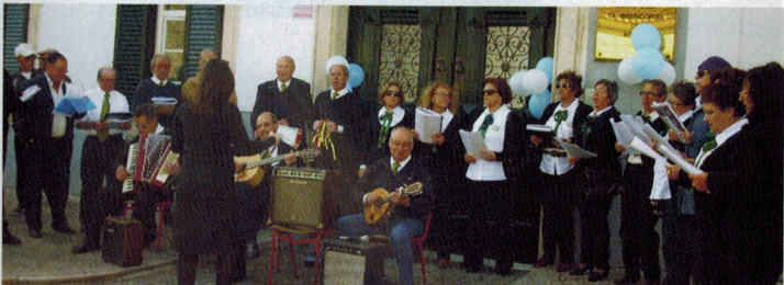
Atuação primaveril no Cine-Teatro de Borba