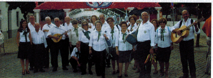
Arruada nas Festas das Flores em Campo Maior