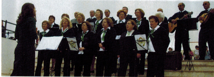
Encontro de Tunas em Évora